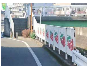
▲灰塚陸橋・通称いちご橋 …地元で愛されている橋