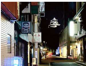
▲中央区桜井通り …角を曲がると見える熊本城