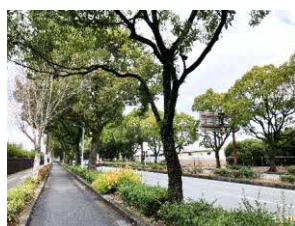
▲健軍駐屯地付近 …緑が和ませる感じがする