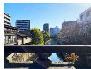
▲新町2丁目 …明八橋より明十橋側に向かって