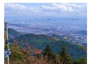
▲熊本市街 …金峰山から望む市街地