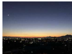
▲自宅からの夜景 …市内が一望できる