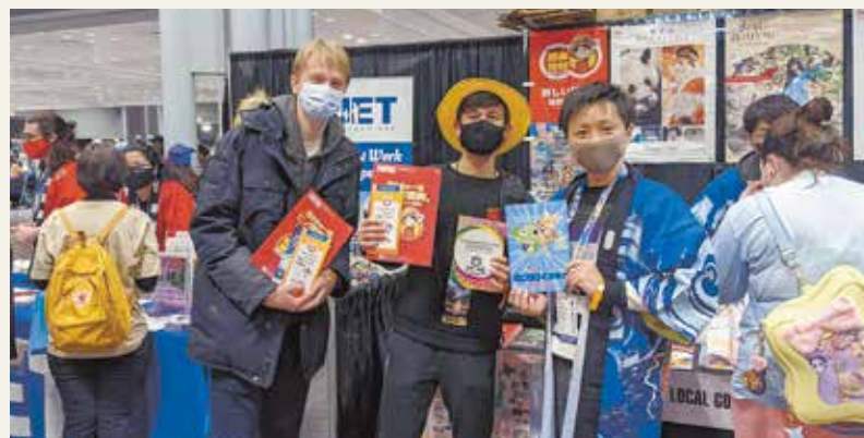
アニメNYでの熊本のプロモーションの様子

本市では、一般財団法人自治体国際化協会のニューヨーク事務所やパリ事務所、熊本上海事務所に職員を派遣し、熊本市の魅力のPRや熊本市の海外での活動支援、熊本市と海外のネットワークづくりなどの取り組みを行っています。