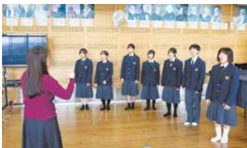
日吉中学校 音楽部