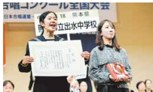
出水中学校 合唱部

「合唱は愛」を伝統のスローガンに掲げる日吉中学音楽部。全国のステージで見事な歌声を披露し銀賞を受賞。さらにこの結果が『声楽アンサンブルコンテスト全国大会』の推薦につながり、3月には福島県の空に美しい歌声を響かせてきたそうです。素晴らしい結果を残せた要因を生徒たちに聞くと、「普段の生活から『素直な心』を意識することが『いい声』につながるという、顧問の先生の教えを徹底したこと」という答えが返ってきました。人間力と歌声にますます磨きをかけ、今年も全国をめざします。