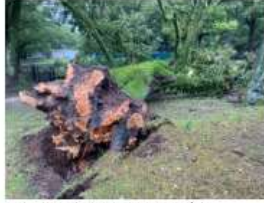
（文化財建造物沿いの倒木）