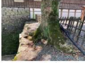
（成長し石垣を押す樹木）