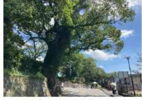
（石垣から生えている樹木）