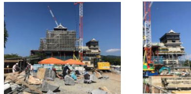
躯体外装等の復旧工事が着実に進む小天守