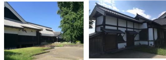
土壁等が破損した本丸御殿大広間