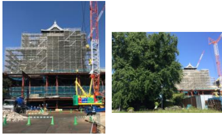
再び勇壮な外観を取り戻した大天守