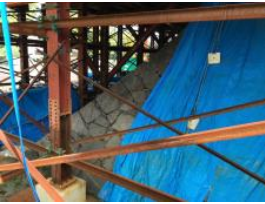
外観復旧が完了した大天守の石垣