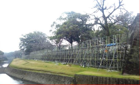
③長堀復旧工事 H31.2月契約締結(継続:H30~32事業)