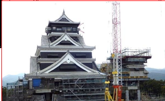
②天守閣復旧整備工事 H29.2月着手(継続:H28~32事業)