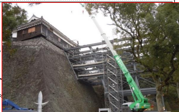
①平櫓解体保存工事 H30.7月着手(継続:H30・31事業)