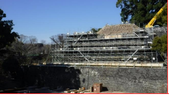
④飯田丸五階櫓石垣復旧工事 ・H30.7石垣解体着手(継続:H30・31事業) ・H31秋頃~ 石垣復旧着手予定(新規:H31・32事業)