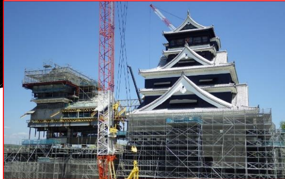
②天守閣復旧整備工事 H29.2月着手(継続:H28~R2事業)