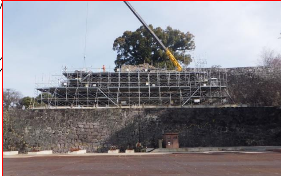
④飯田丸五階櫓石垣復旧工事 ・H30.7月 石垣解体着手(継続:H30・R1事業) ・R1秋頃~ 石垣復旧着手予定(新規:R1・2事業)