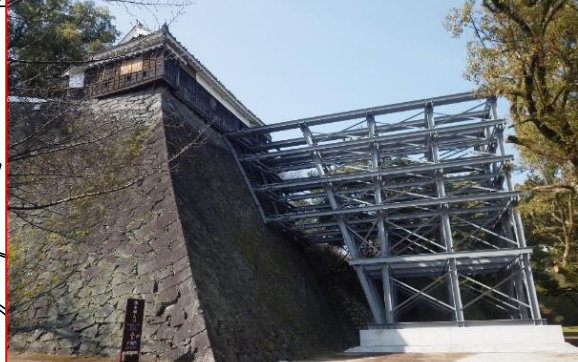
①平櫓解体保存工事 H30.7月着手(継続:H30・R1事業)