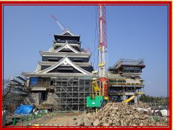
⑦ 天守閣前広場から復旧が進む大小天守を望む