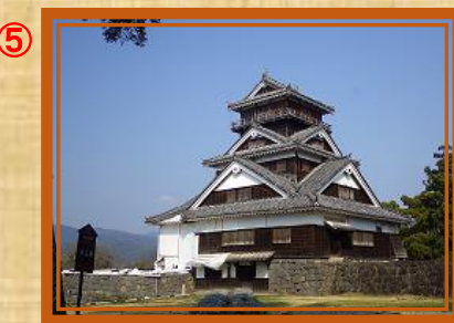
⑤ 宇土櫓から ⑥ 天守閣南西面 工事用第2 スロープから 天守閣前広場へ