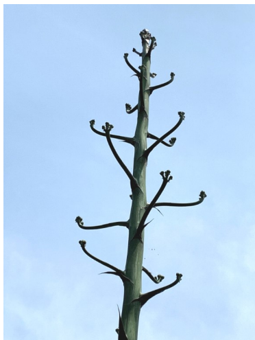
（膨らみはじめたつぼみ部分：6/8撮影）