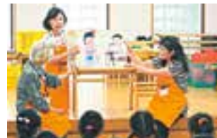
保育園で活動する8020推進員

南区では、歯と口腔の健康づくりを進めるために活動する地域のボランティア「8020推進員」の養成講座の受講生を募集します。現在、「8020推進員」は保育園、小学校、地域の高齢者サロン等で歯の大切さを発信する活動をされています。