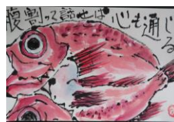
絵手紙講座受講生の作品