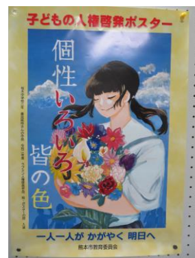
(場所: センター1階ロビー)

先月より、館内では「子どもの権利条約」に関わるポスター等(市民よりのデザイン)を中心に掲示しています。ポスターをよく見ると、あのかわいいラブミンが「ナイト」に変身しています。見つけましたか?