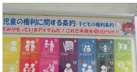
(場所: センター2階通路)