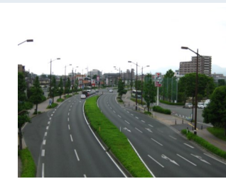
<国体道路東西線-長嶺付近>