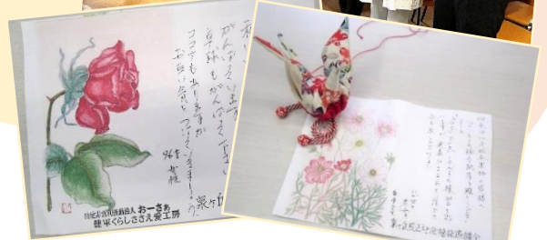
▲返信用の便せんには、民生委員さんによって綺麗なお花が描かれています