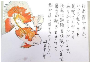
▲中学生からの絵手紙

中学生の書いた絵手紙が、8月12日、泉ヶ丘校区民生委員児童委員の皆さんによって、地域の高齢者や障がい者の方などに届けられました。絵手紙には、日ごろの見守りへの感謝や、頑張っていること、将来の夢など、元気あふれる内容が書かれていました。