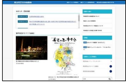
龍田校区自治協議会ホームページ https://tatsuda-community.com/