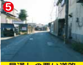
見通しの悪い道路