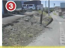
③ 斜面にて路面が露出 崩落の危険あり

※このハザードマップは自治会で作成しました。マップは初版ですが今後は新しい災害対策情報や災害実績を導入していきます。