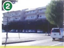
② フーディワン 駐車場