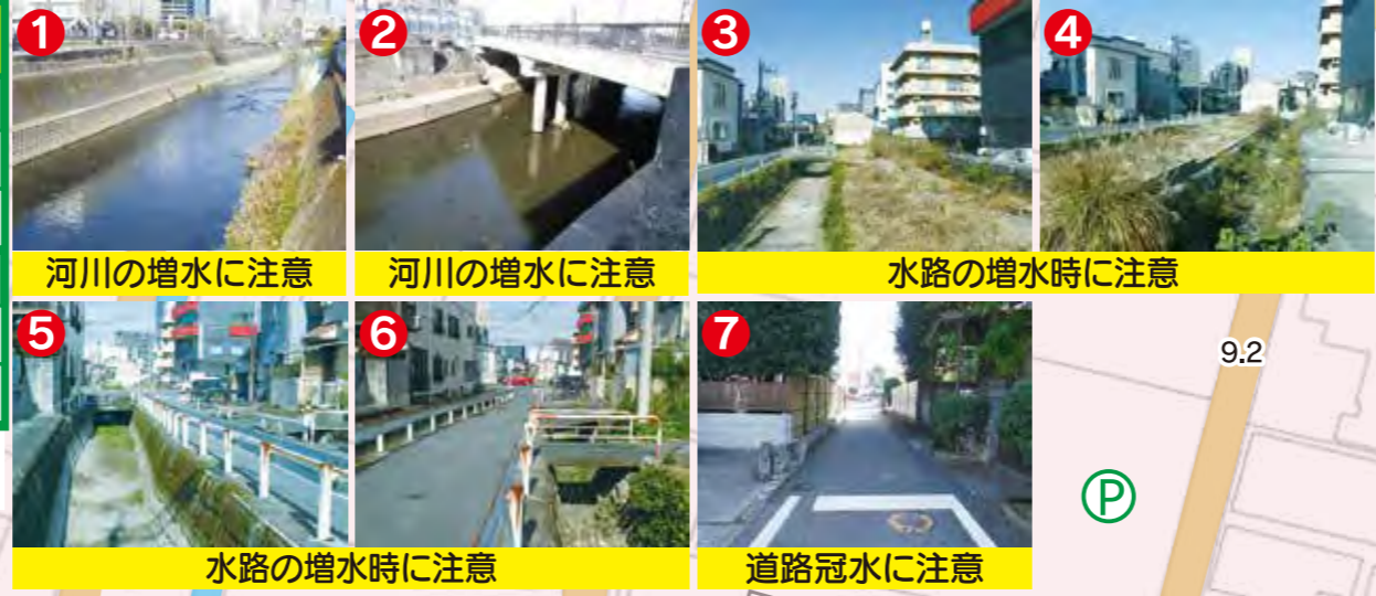
1 河川の増水に注意 2 河川の増水に注意 3 水路の増水時に注意 4 水路の増水時に注意 5 水路の増水時に注意 6 水路の増水時に注意 7 道路冠水に注意