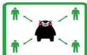
くっつかないモン #KeepDistance