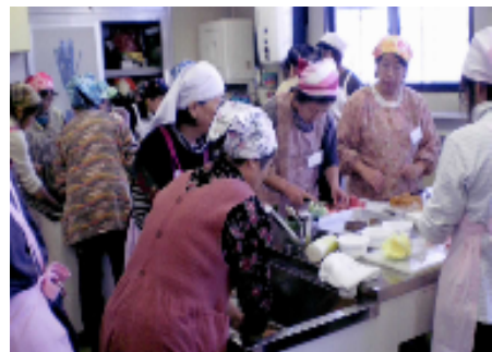
[食生活改善推進員による減塩料理教室]