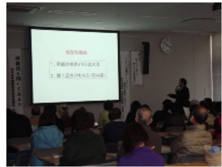
[熊本中央病院 有菌先生の講話]

*「くまもと減塩美食メニュー」や健康づくりできます店の情報等は、熊本市のCKD ホームページからご覧いただけます。