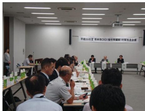
【意見交換会の様子】