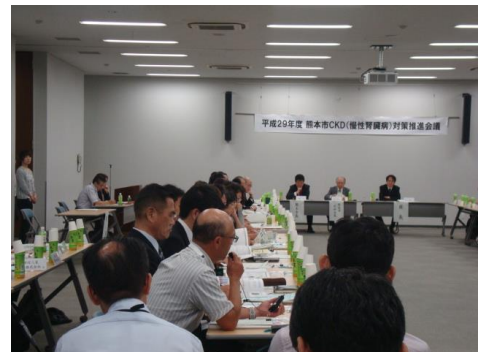
【意見交換会の様子】