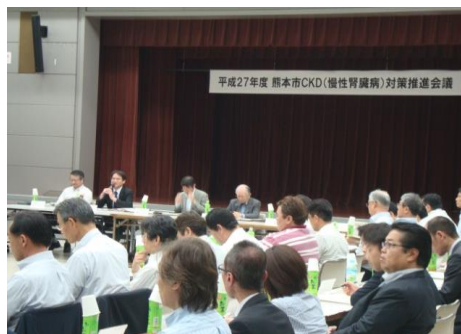
【意見交換会の様子】