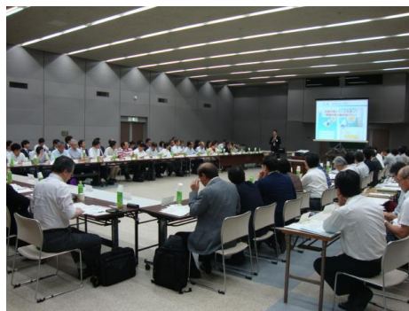
【取り組み報告の様子】

この会議は、CKD対策を推進するために、幅広い関係機関が相互に連携を図り、事業を展開することを目的としています。今年度の会議では熊本県栄養士会、熊本PK-PD研究会、熊本臓器移植コーディネーターの方からCKD対策の取り組みを御報告いただきました。また意見交換会においても様々な意見交換ができました。また提出いただきました平成27年度アクションプランも参加者同士の情報共有資料として活用いたしました。参加者から「具体的な取り組みについて知ることができよかった」「有意義な会議であった」と感想が寄せられました。今後も皆様と連携して、CKD対策を進めてまいりたいと思いますので、ご協力よろしくお願いたします。