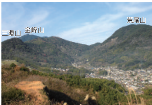
▲石神山の展望所から見た景色