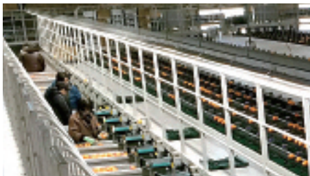
▲みかん選果場の様子