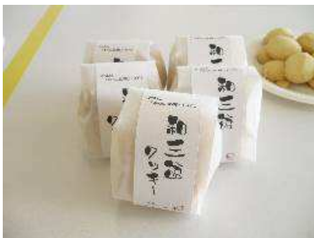
和三盆クッキー ライン工房