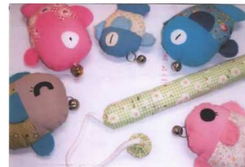
おさかなつりセット こまちの森