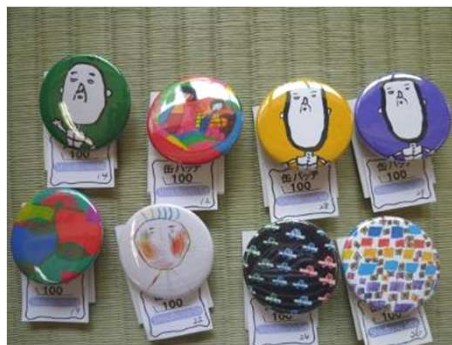
缶バッジ しょうぶの里