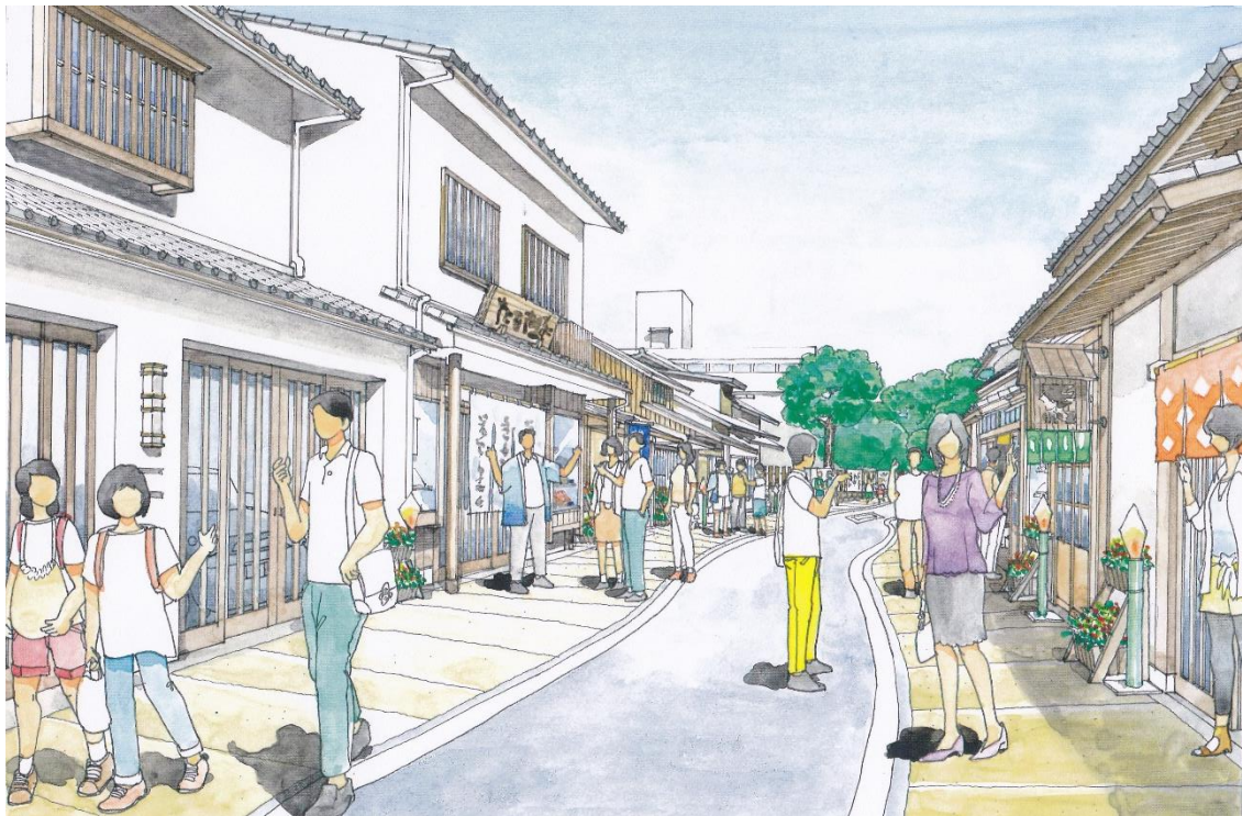
(小路町改修後のイメージ)

この事業は、川尻地区にある建物などの所有者や居住者の方が、町並み協定の基準に沿った町屋などの「伝統的な建造物の保存・修景のために行う工事」や、一般建造物の「川尻地区の歴史が醸し出す伝統的な雰囲気を感じられる町並みとの調和を図るための工事」に対して、予算の範囲内において、 外観工事費の一部を助成 するものです。