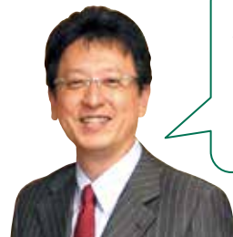
熊本市市長 大西 一史

きめ細やかな指導ができることは大きなメリットですが、学級数の増加に伴い、どうやって質の高い先生を多数確保するのか、教室を確保するのかという問題もあります。モデル校を設置して段階的に実現できればと思います。