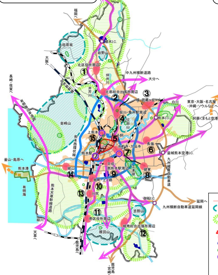
都市の全体構成図