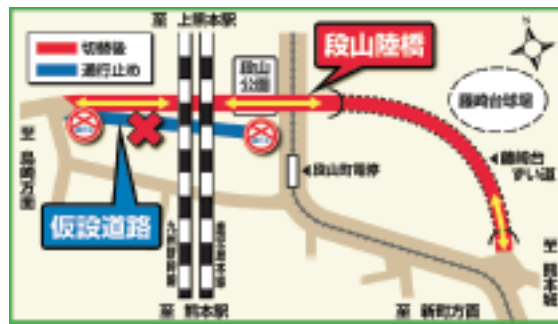
(熊本駅周辺整備事務所 ☎323-8177)