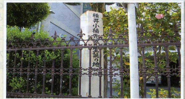
▲小楠生誕地(熊本中央高校正門)