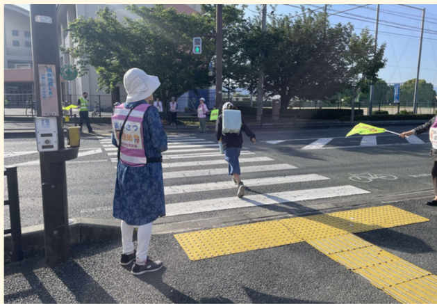
あいさつ運動の様子(桜木東校区)

高齢者の見守りや支援が必要な人の相談に応じ、関係機関と連携して適切な福祉サービスにつながります。また、こどもや子育てに関する相談や環境づくりにも取り組んでおり、児童福祉を専門に担当する「主任児童委員」もいます。