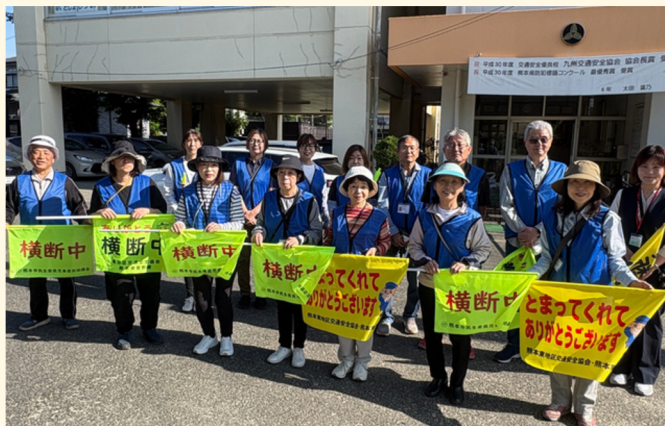
若葉校区民生委員・児童委員の皆さん

「民生委員・児童委員」の日をきっかけに、より多くの方が民生委員について知っていただくと良いのかなと思います。