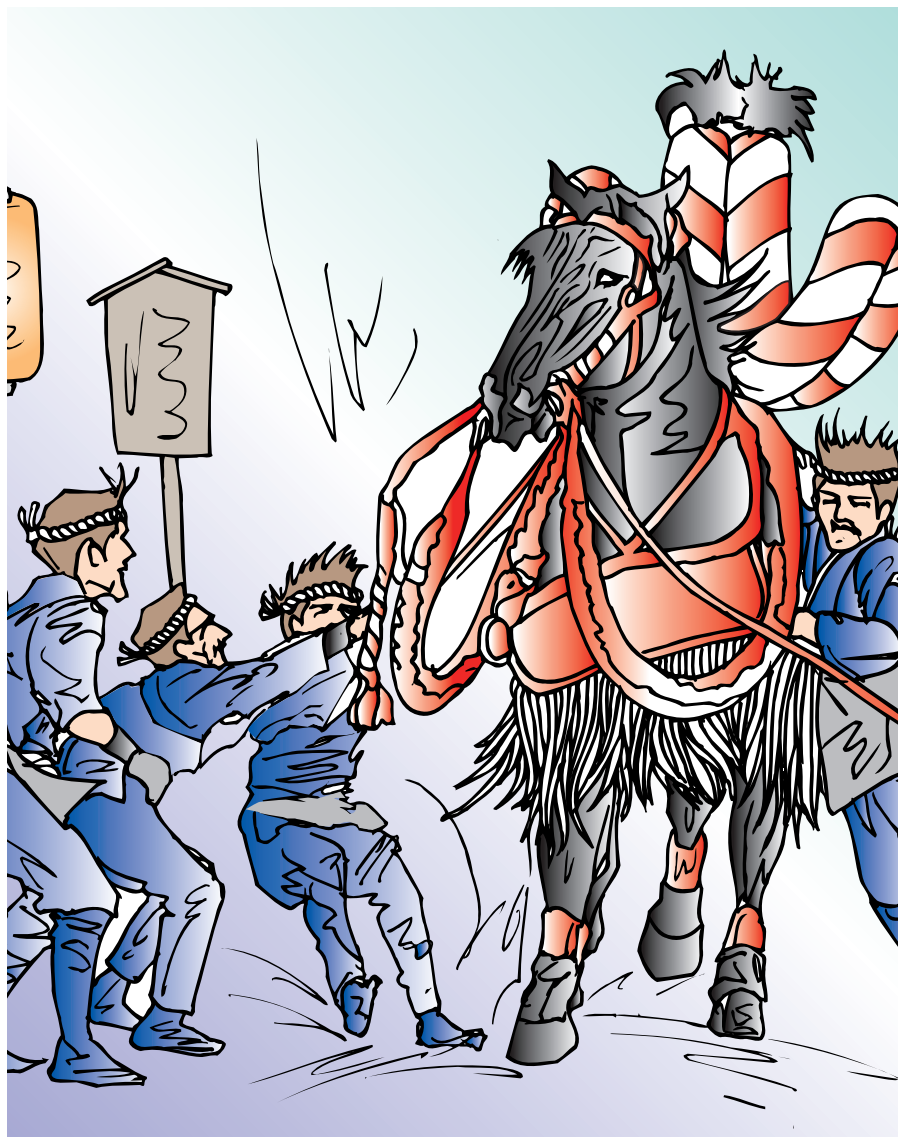
藤崎宮秋季例大祭

熊本市・富合町合併協議会は、昨年1月5日の設置以来、合併に関するあらゆる事項の協議を重ねてきましたが、去る9月1日に開催した第12回目の協議会で協議を終え、10月5日をもって解散することとなりました。 10月6日には、新「熊本市」が誕生し、新たなスタートを切ることになります。