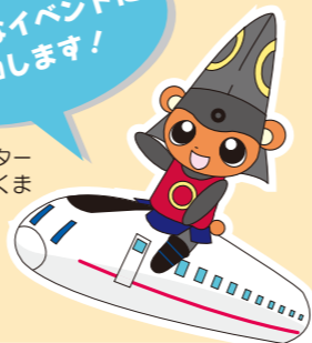
イメージキャラクター きよくま