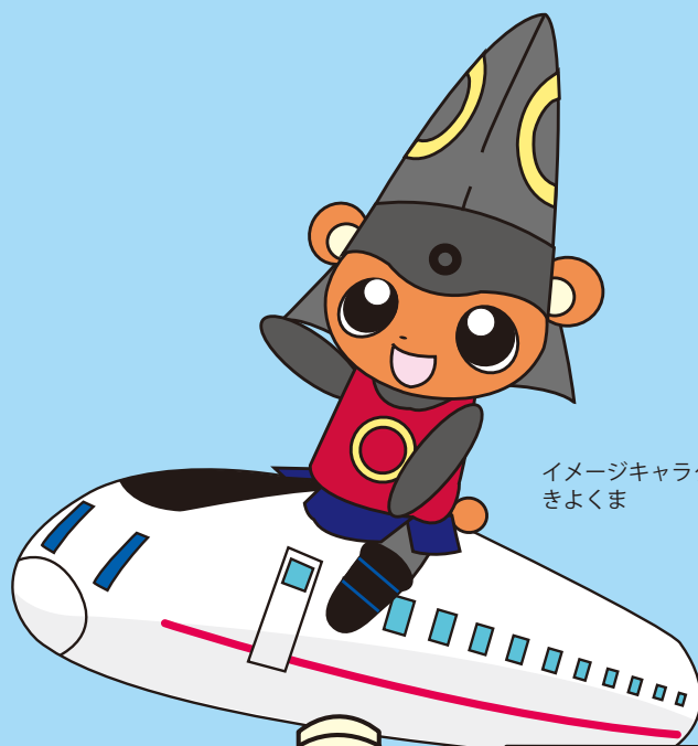
イメージキャラクター きよくま