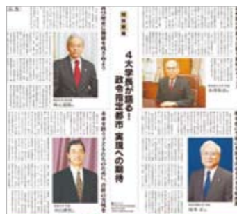
■平成21年4月2日(木) 熊本日日新聞広告掲載