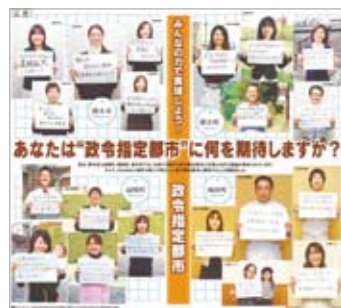
■平成21年3月30日(月) 熊本日日新聞広告掲載