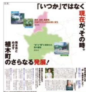
■平成21年6月18日(木) 熊本日日新聞広告掲載