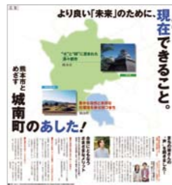
■平成21年6月17日(水) 熊本日日新聞広告掲載