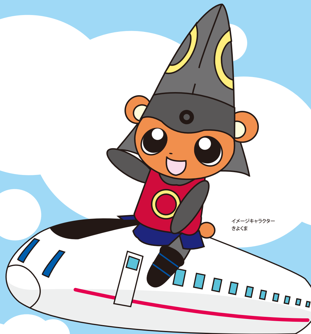
イメージキャラクター きよくま