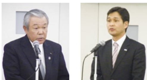
村上一也 副会長 幸山政史 熊本市長