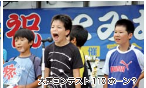
大声コンテスト110 ホーン?