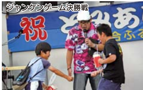
ジャンケンゲーム決勝戦