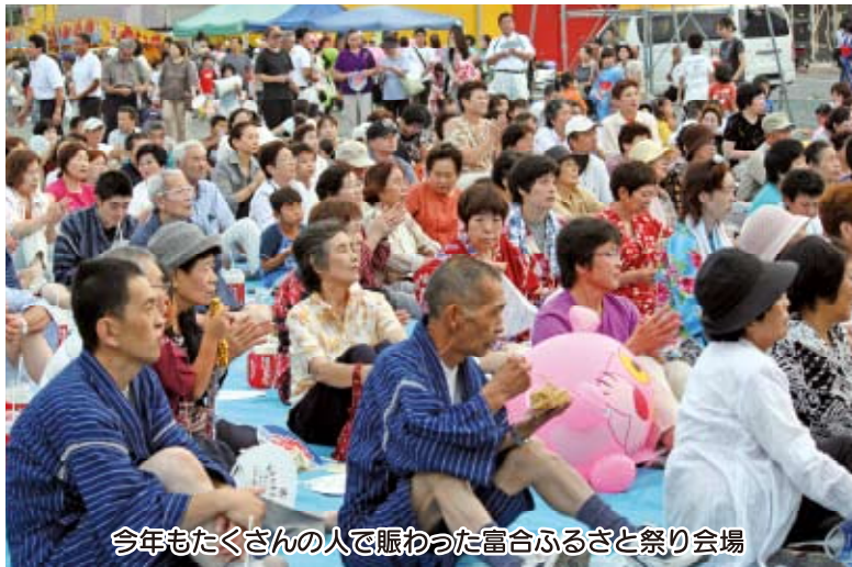
今年もたくさんの人で賑わった富合ふるさと祭り会場