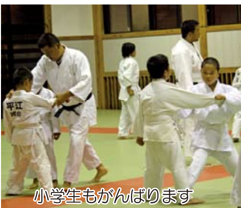
小学生もがんばります