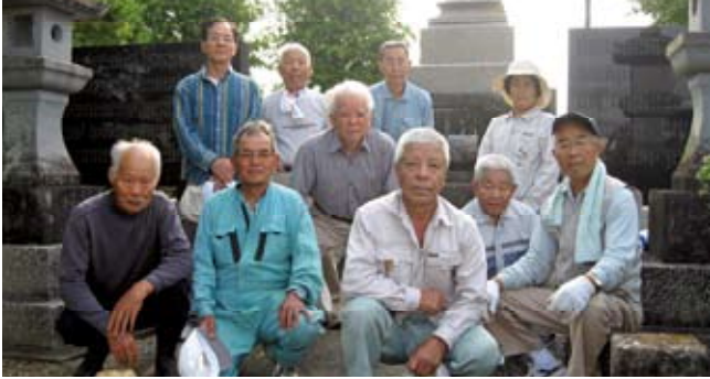
6月は榎津の担当でした。

夏 私たちの心にあるのは64年前戦争で犠牲になった方々のことです。昭和34年に建立された慰霊碑周辺は毎月、遺族会が清掃を担当。月別当番です。今回は6月と8月の様子を紹介します。