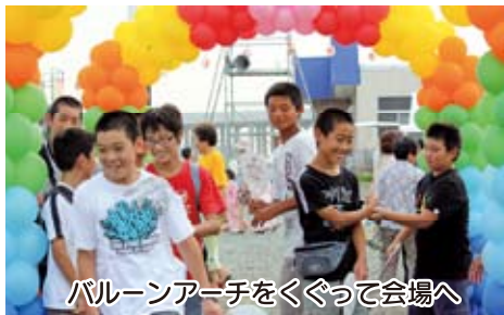
バルーンアーチをくぐって会場へ