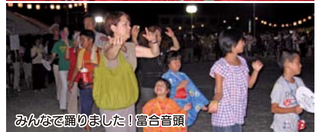
みんなで踊りました！富合音頭