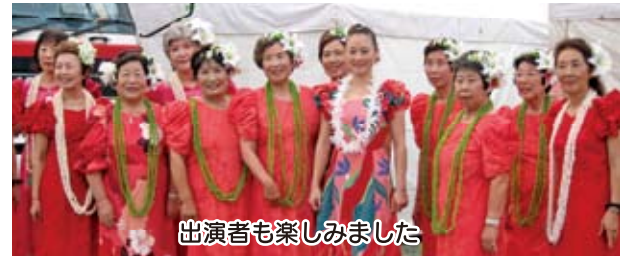
出演者も楽しめました