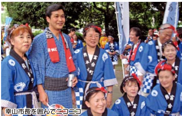
幸山市長を囲んでニコニコ

熊本市民として最初の「火の国まつり」に大いにハッスル。「ハッスル賞」を授賞。(75名が参加)