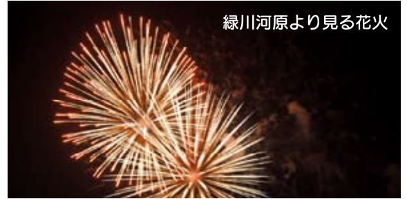
緑川河原より見る花火

今回は長雨の影響で会場を「アスパル富合」西側広場に変更。3000人を超える人が集合。花火は緑川河原で実施。「玄海竜二ショー」は歌と踊りそして「いつも笑顔で」「何があっても笑顔で」の言葉に感動と笑顔が会場いっぱいになったようでした。古城みゆき歌謡ショーはふるさとを想う気持ちが伝わり、軽やかなハワイアンのリズムもフラダンスも最高！