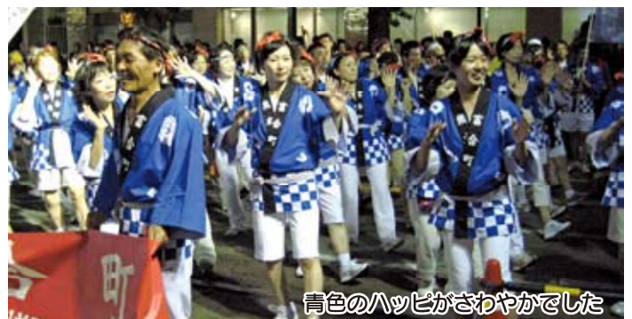
青色のハッピがさわやかでした

熊本市民として最初の「火の国まつり」に大いにハッスル。「ハッスル賞」を授賞。(75名が参加)