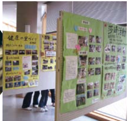
健康の里づくり推進員・活動報告