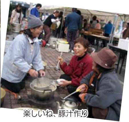
楽しいね、豚汁作り