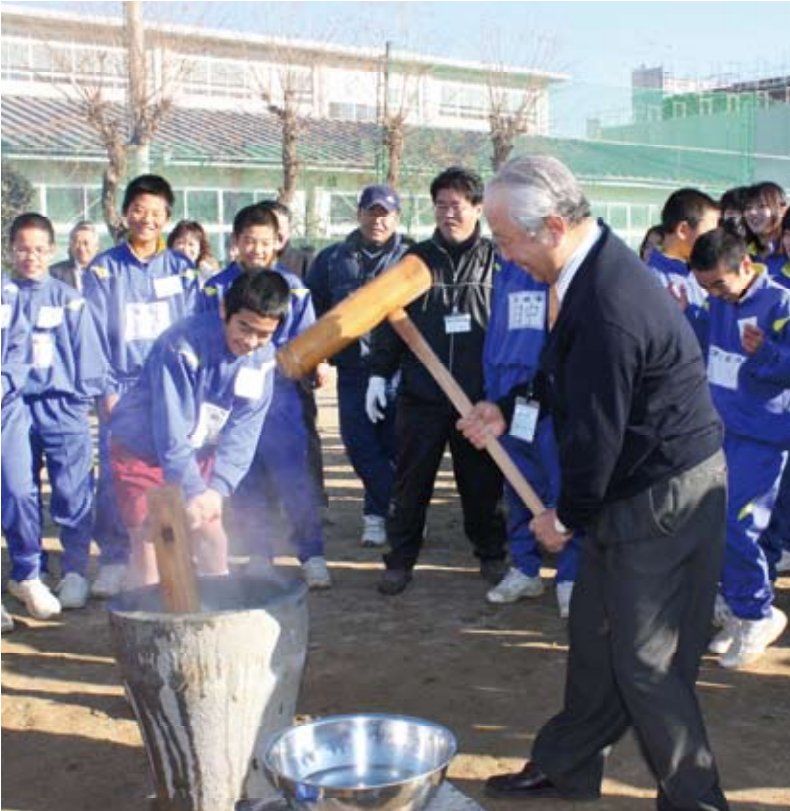
▲ 中学校伝統行事・合格田餅つき