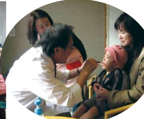
アーン!虫歯の検査です