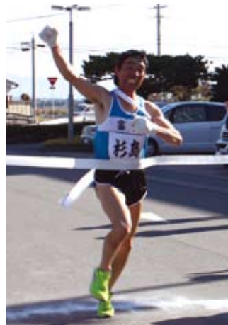
ゴール!カッコイイ…!