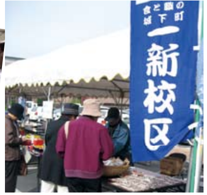
一新校区からも出店