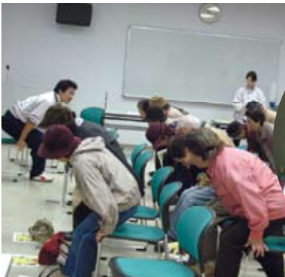
筋肉づくり、続けてますか?