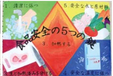
中1 西島 綾乃