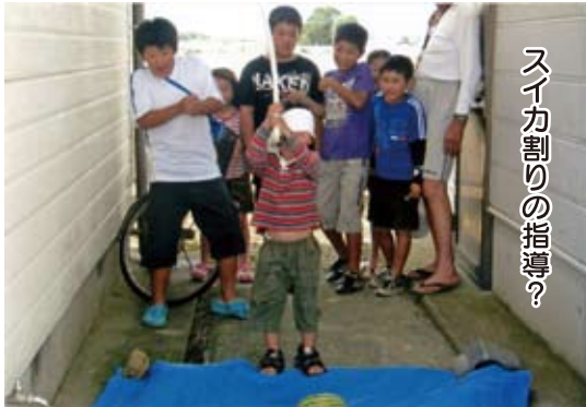
スイカ割りの指導？