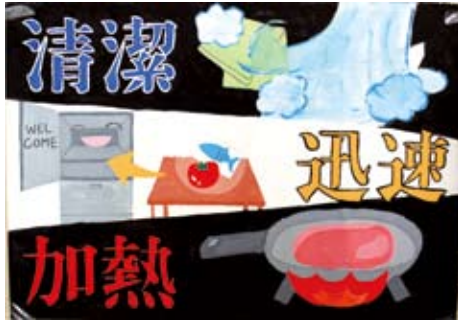
中2 櫻井 千華