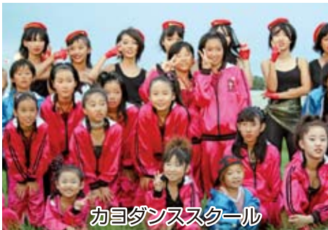
カヨダンススクール