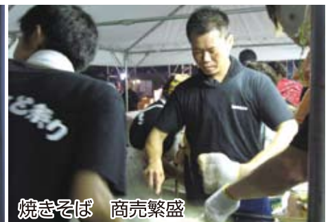
焼きそば 商売繁盛