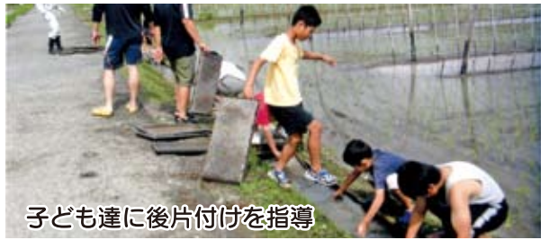
子ども達に後片付けを指導