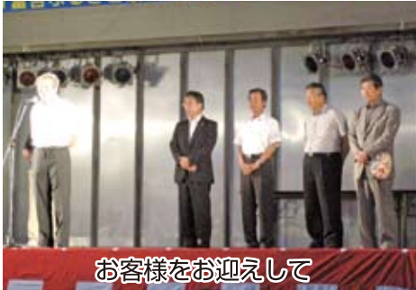
お客様をお迎えして

7月31日(土)午後6時「大声コンテスト」で「富合ふるさと祭り」は開幕。曇り空と涼しい風の緑川河原は約2,500人でにぎわいました。ジャンケンポン大会、舞台でのショーを楽しみ、肥後にわかで笑い、富合音頭をみんなで踊り、お楽しみ抽選で緊張し、最後は「花火大会」で元気になったのではないのでしょうか。今年も準備、会場設営、当日の運営、交通・駐車場整理と多くの人の協力がありました。ありがとうございました。