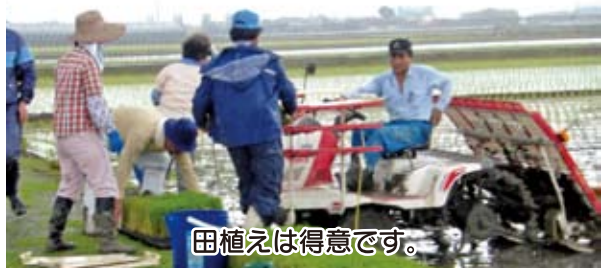
田植えは得意です。

西田尻区は富合町で戸数が1番少ない区です。地域づくりに大きな力を発揮する老人会は古代米の田植え、稲刈り、粃摺り、地域の花壇づくり、草取り等で活動。楽しみは子ども達とのふれあいと親睦旅行。「天草に魚つりなど最高です」と森下会長。仲間づくり、地域づくりを楽しむ会です。