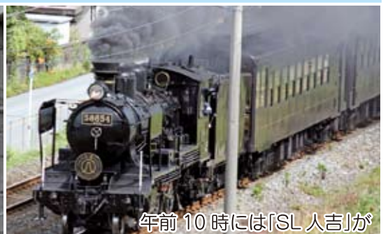
午前10時には「SL人吉」が