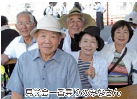
見学会一番乗りのみなさん