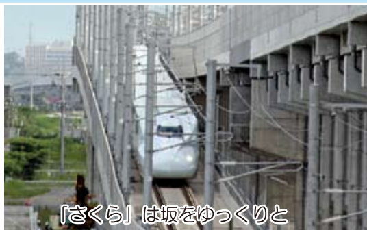
「さくら」は坂をゆっくりと

8月31日午前9時すぎ走行試験のため、熊本総合車両基地を出発。古閑跨線橋には「さくら」を見ようと多くの人が集まっていました。