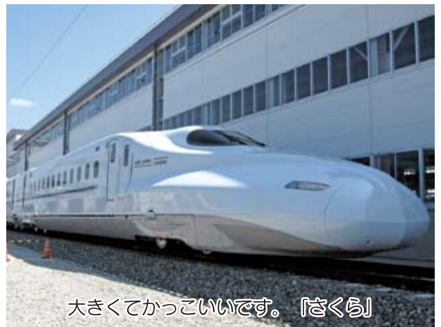
大きくてかっこいいです。「さくら」