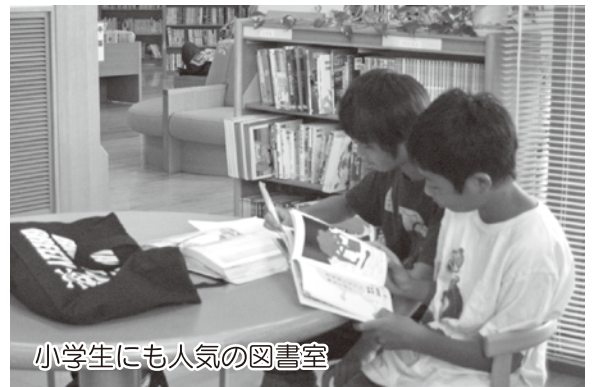
小学生にも人気の図書室

7月の利用者は2,121人、本の貸出しは11,000冊と合併前の3～4倍ですが、富合町民の利用はあまり増えていません。まちの図書室をもっと利用しましょう!