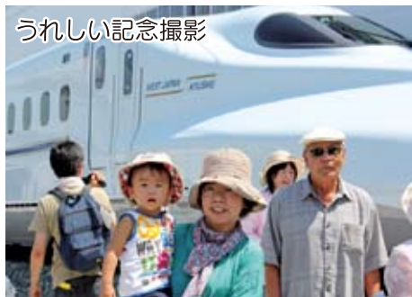
うれしい記念撮影