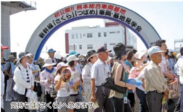
気持ちは「さくら」へ急ぎます。

九州新幹線の「熊本総合車両基地」の地元見学会が8月21日(土)に開催され、公募見学者と地権者など関係者約1000人が集まりました。新大阪直通のN700系「さくら」は白藍色、九州内を走る800系「つばめ」は白色。この両車両も展示され、新しい、ゆったりした座席の座り心地を楽しんでいました。「かっこよかった」「来年の夏休みは鹿児島か新大阪に行きたい」「車両基地で働きたい」「新幹線の運転手になりたい」など子ども達の声は元気いっぱい。「見学コース」設定のうれしいニュースを聞くことも出来ました。車両の走行試験も始まっています。