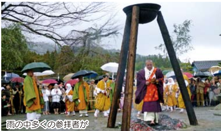
雨の中多くの参拝者が