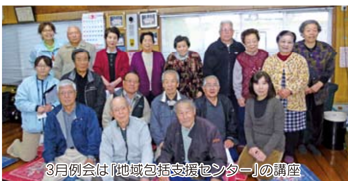
3月例会は「地域包括支援センター」の講座