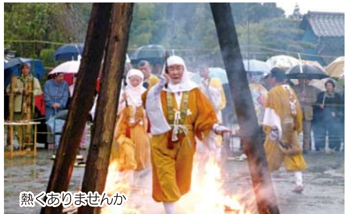
熱くありませんか