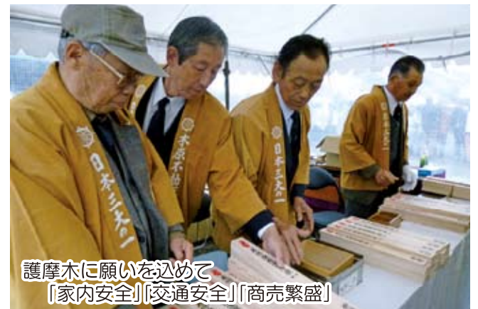
護摩木に願いを込めて 「家内安全」「交通安全」「商売繁盛」