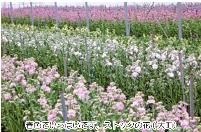
春色でいっぱいです。ストックの花(大町)

富合町の産業の中心は農業です。田んぼの麦の緑も濃くたくましくなってきました。ハウス栽培も盛んな地区です。春を求めて2軒の農家・ハウスに行ってきました。