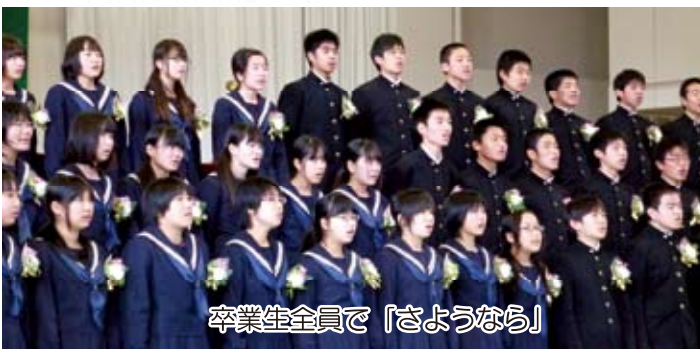
卒業生全員で「さようなら」

富合中学校卒業式は3月11日。在校生、先生、保護者、そして地域の方々の見守る中、一人一人に卒業証書が授与され、66名が9年間の義務教育を終了。