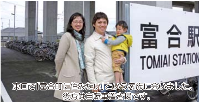
東口で「富合町に住みたい」という家族に会いました。 後方は自転車置き場です。