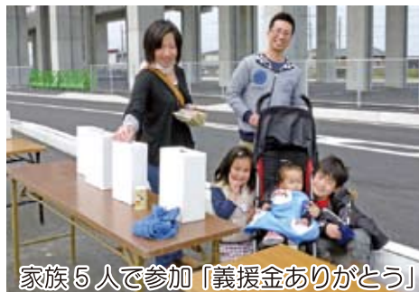
家族5人で参加「義援金ありがとう」

4月3日（日）に新幹線車両基地外周道路で開催され、約550人が参加。午前10時に富合駅東口を出発。外周約3kmを45分～1時間掛け歩きました。富合駅を利用した参加者も多かったようです。