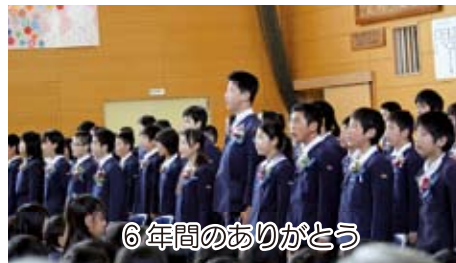
6年間のありがとう