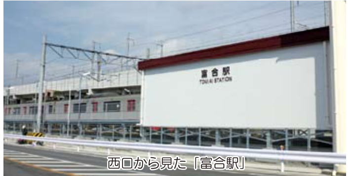
西口から見た「富合駅」