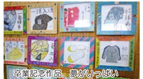
卒業記念作品 夢がいっぱい