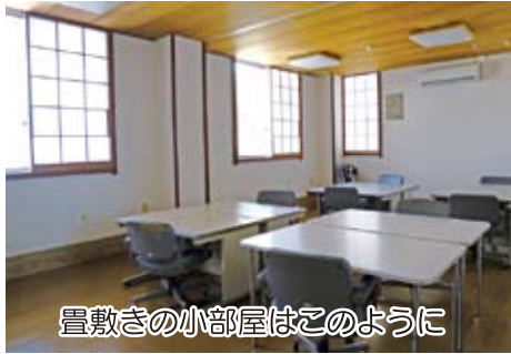
畳敷きの小部屋はこのように