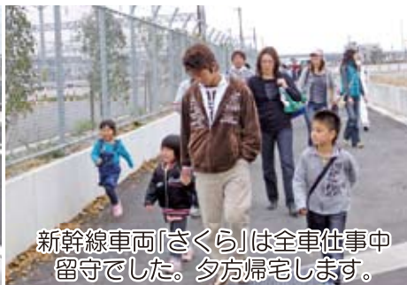
新幹線車両「さくら」は全車位事中留守でした。夕方帰宅します。