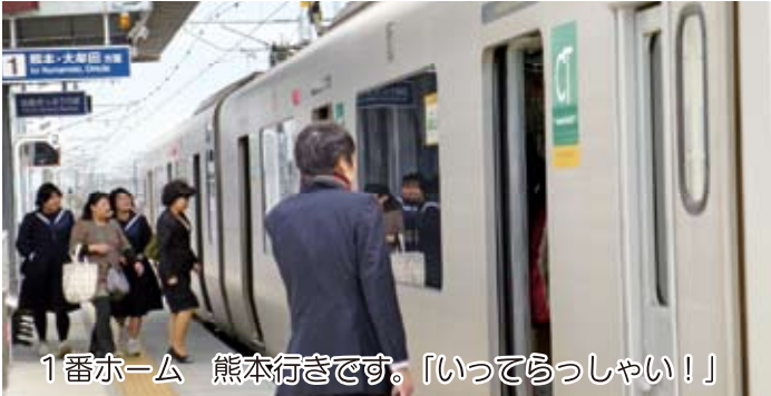
1番ホーム 熊本行きです。「いってらっしゃい！」

熊本駅まで約10分。無人駅ですが、通勤・通学、おでかけに利用出来ます。駐輪場は準備できましたが、有料駐車場はもうしばらくお待ちください。