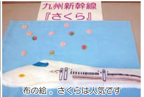
布の絵。さくらは人気です