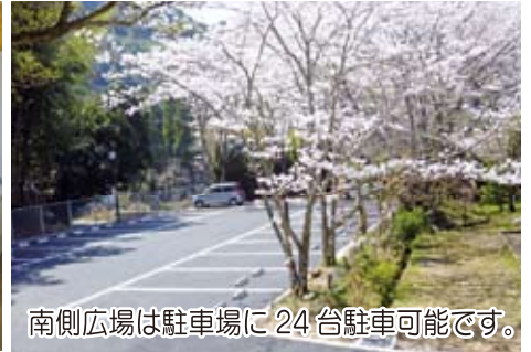
南側広場は駐車場に24台駐車可能です。