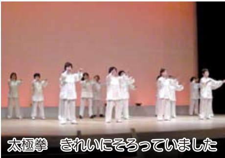
太極拳 きれいにそろっていました