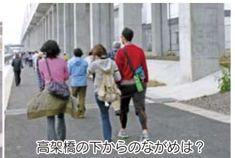
高架橋の下からのながめは？