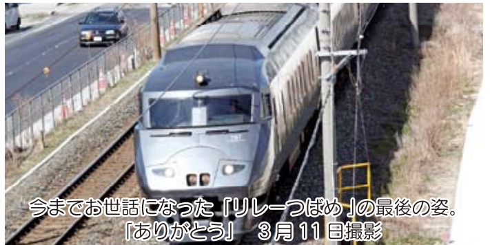
今までお世話になった「リレーつばめ」の最後の姿。 「ありがとう」 3月11日撮影