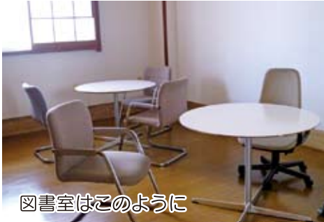
図書室はこのように

新しくなった部分を一部紹介します。大広間は畳・障子が新しくなり、段差解除の工夫が加わりました。写真撮影の日は桜が満開。窓からの眺めは最高。ぜひ多くの方のご利用をお願いします。利用料金等は変わりません。休館日は水曜日・土曜日（祝日・年末年始は異なります）送迎バスは月曜日・火曜日・金曜日に町内を定期ルートで送迎。事前に利用申込みをしていただくと定期利用以外も送迎します。 問い合わせ先 電話 096-358-1592 〒861-4153 熊本市富合町木原2319-1