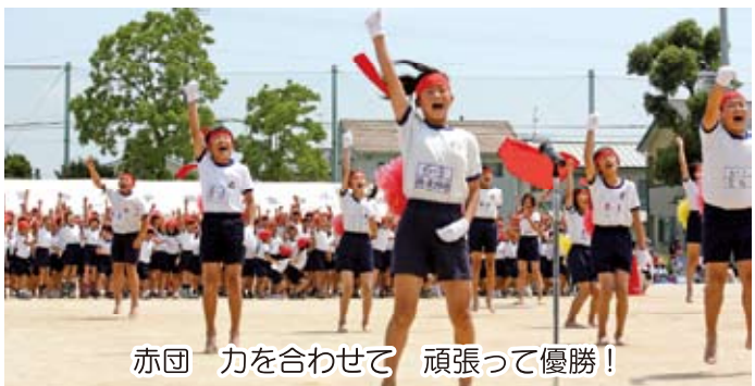
赤団 力を合わせて 頑張って優勝！

5月30日、雨で順延にはなりましたが、さわやかな運動会日和。「私たちは、力いっぱい走ります」「いっしょうけんめい踊ります」「転んでもあきらめません」と1年生の元気な開会の言葉で始まった運動会は、きびきびとした児童の力で大成功！