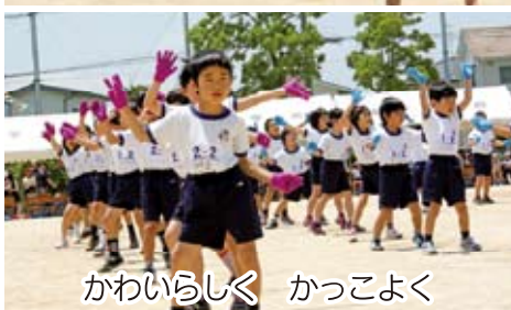
かわいらしく かつこよく