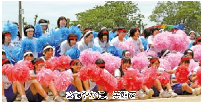
さわやかに、笑顔で