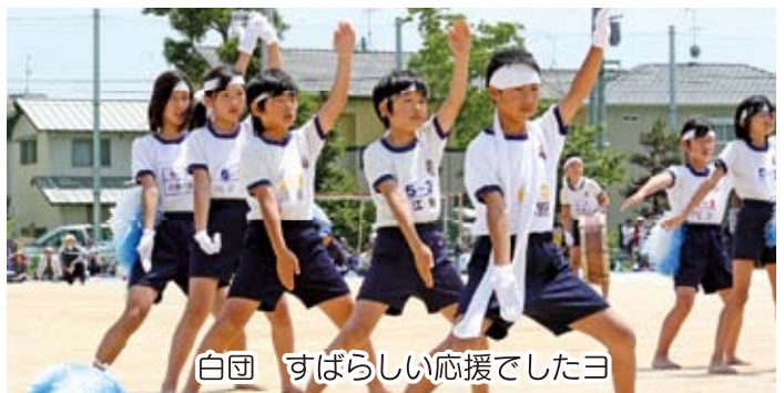
白団 すばらしい応援でしたヨ