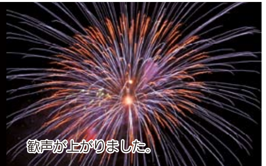
歓声が上がりました。