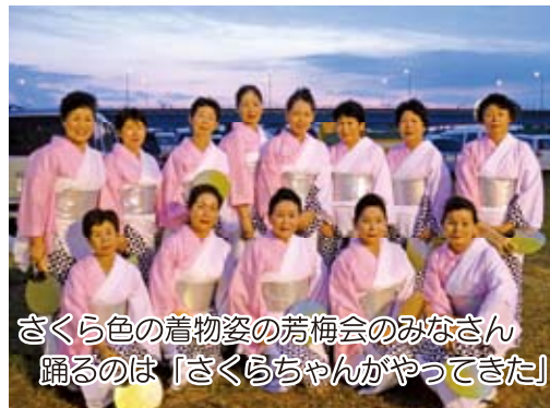
さくら色の着物姿の芳梅会のみなさん 踊るのは「さくらちゃんがやってきた」