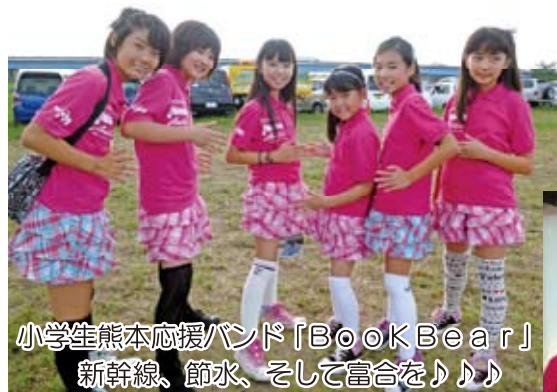
小学生熊本応援バンド「Book Bear」 新幹線、節水、そして富合を♪♪♪