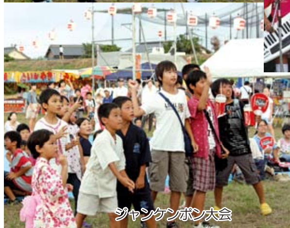
ジャンケンポン大会