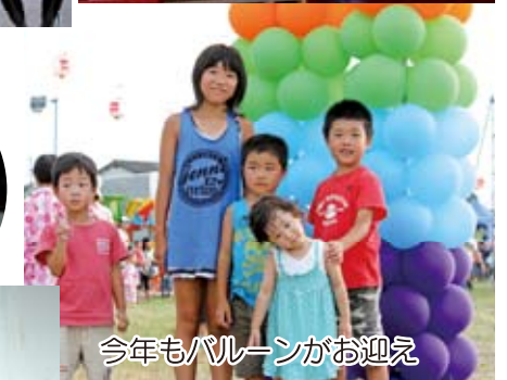
今年もバルーンがお迎え