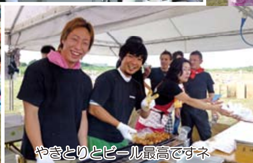
やきとりとピール最高ですネ