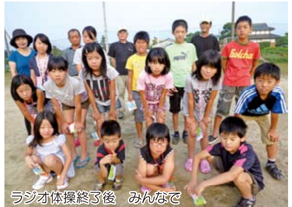
ラジオ体操終了後 みんなで