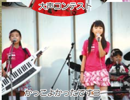
かっこよかったですヨ