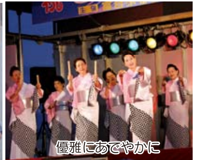
優雅にあでやかに