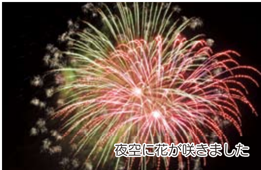
夜空に花が咲きました

7月30日(土)、緑川河川敷に約2,800人が集合。舞台での音楽、おどり、英太郎ショー。みんなで踊った富合音頭。夜店はおおぜいのお客さんでにぎわいました。準備いただいた方々、そして交通整理の方々に感謝します。ありがとうございました。