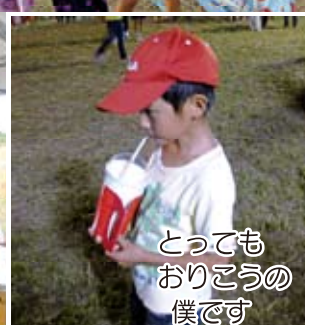
とっても おりのうの 僕です