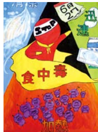
中学2年 西島 綾乃