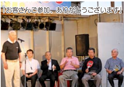
「お客さんご参加、ありがとうございます」