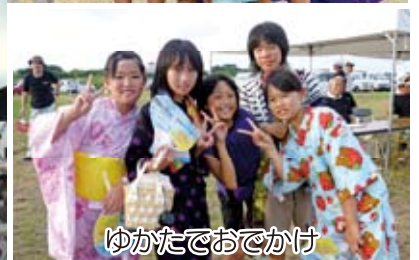
ゆかたでおでかけ