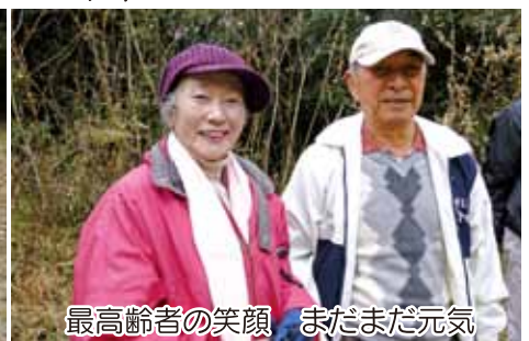
最高齢者の笑顔 まだまだ元気