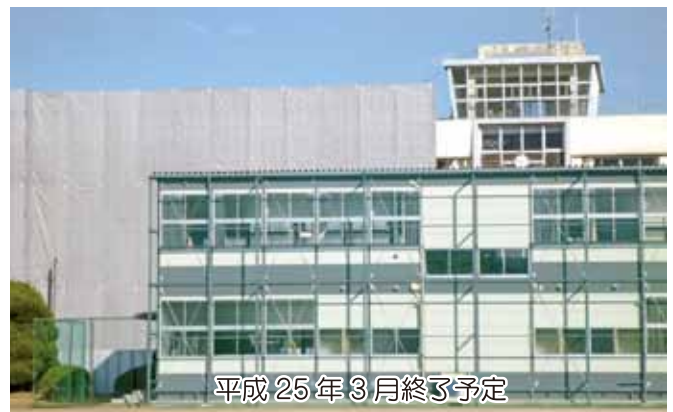
平成25年3月終了予定