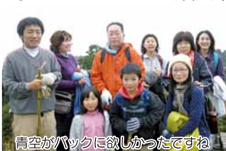
青空がバックに欲しかったですね

「おめでとうございます」「ひさしぶり!」「今年もよろしく」と明るい声が飛び交います。午前11時、第1展望所を目指し45名が「老人憩い家」前を元気に出発。約40分で到着。小・中学生は頂上まで歩をのぼしていました。展望所広場で楽しみは「輪なげゲーム」。また来年!