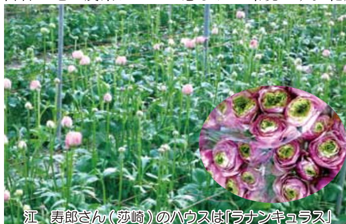
江 寿郎さん（莎崎）のハウスは「ランキュラス」

富合の地は農業にとって恵まれた環境です。花農家を紹介します。ハウスの中は春でした。