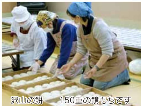
沢山の餅 150重の鏡もちです

平成23年12月22日(木)9時に集合して餅をつきをしました。75歳以上の一人暮らしの方へ鏡もちと小餅を届けました。今回は小学生も一緒に訪問。知り合いに、仲良しになれるといいですね。