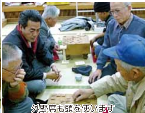
外野席も頭を使います