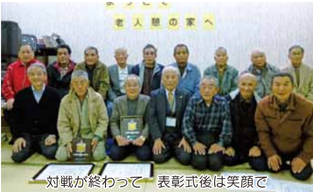
対戦が終わって 表彰式後は笑顔で

老人憩の家に22人(囲碁10人、将棋12人)が集った大会は熱戦続き。終了は午後4時。碁盤、将棋盤をジーと見つめる顔に感動。頭の運動です。「この大会を機会に愛好会、サークルが結成され、広がるといいですね」との声もありました。ぜひ実現を!