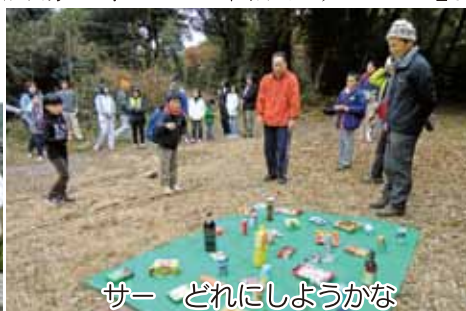
サー どれにしようかな