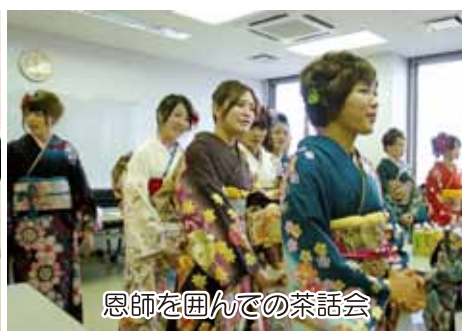
恩師を囲んでの茶話会