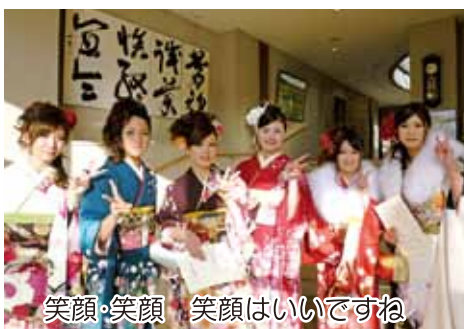
笑顔・笑顔 笑顔はいいですね