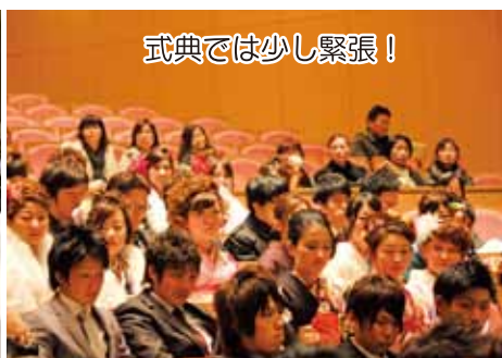
式典では少し緊張！