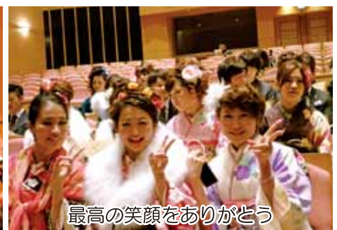
最高の笑顔をありがとう