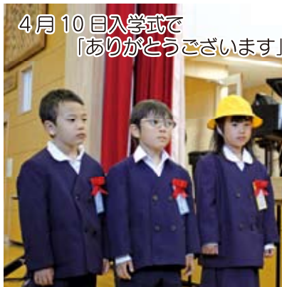
4月10日入学式で「ありがとうございます」