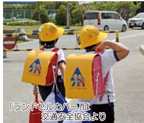
「ランドセルカバー」は交通安全協会より