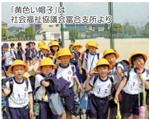
「黄色い帽子」は社会福祉協議会富合支所より