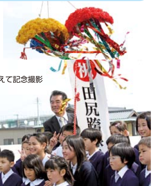
大役を終えて記念撮影