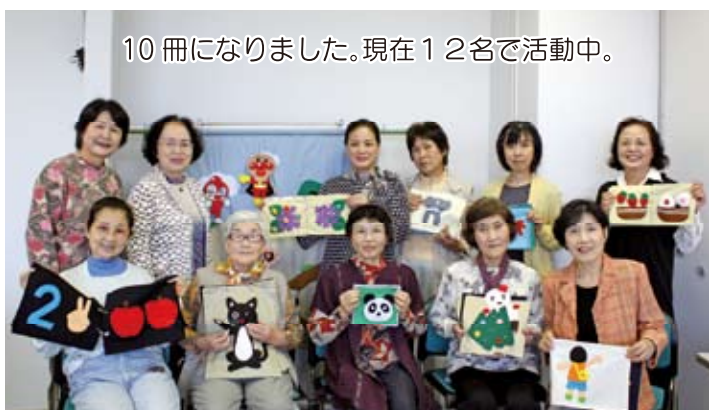
10冊になりました。現在12名で活動中。