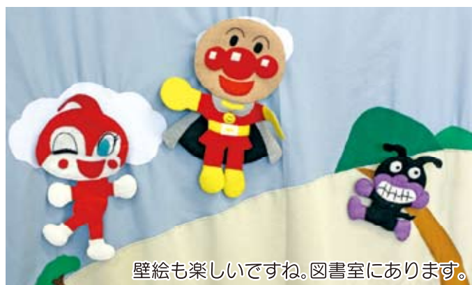
壁絵も楽しいですね。図書室にあります。