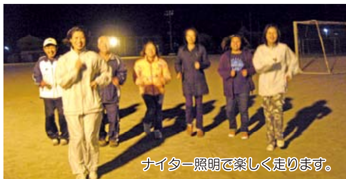
ナイター照明で楽しく走ります。