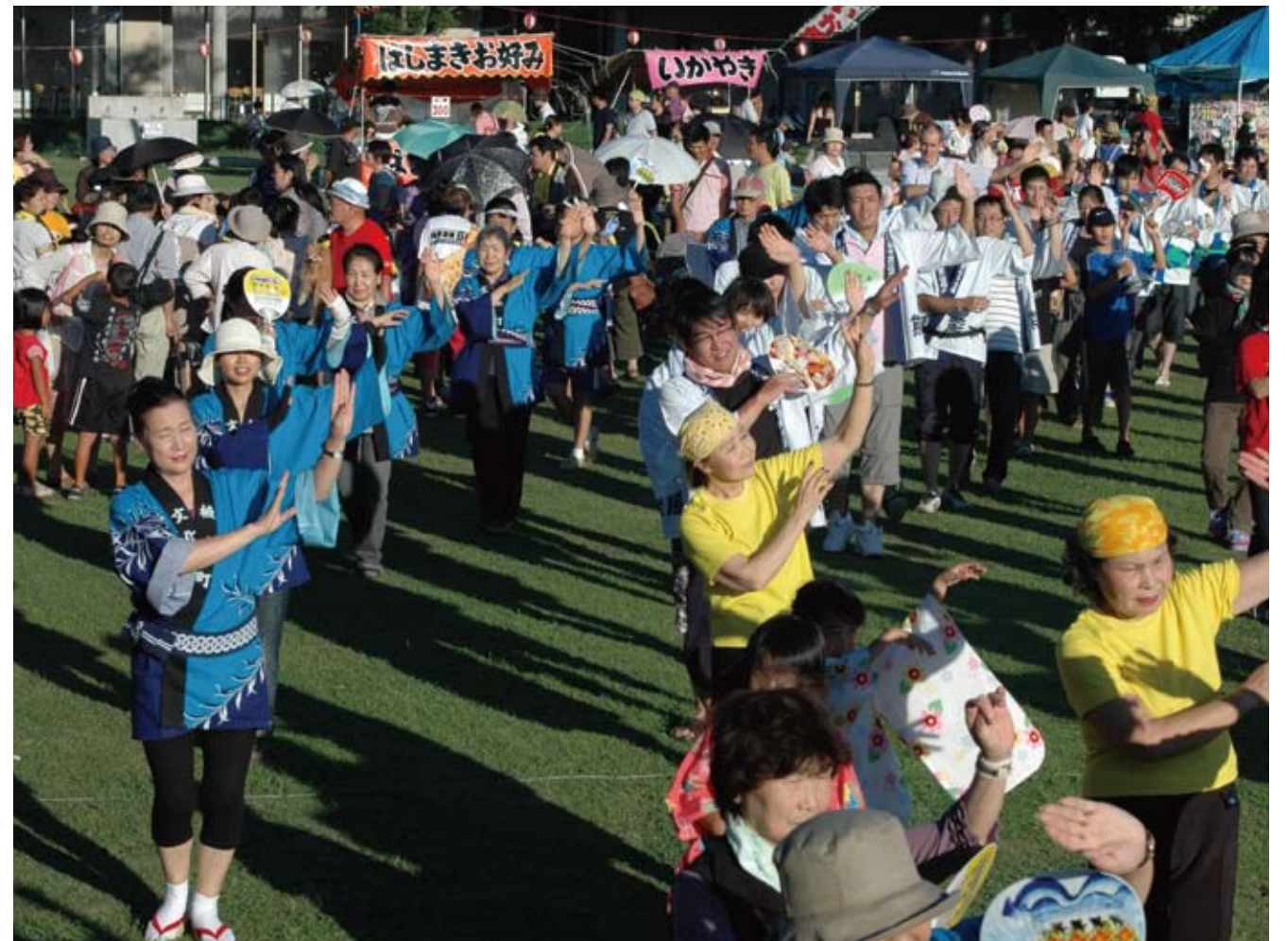
▲第38回植木町はってん祭 町民総おどり