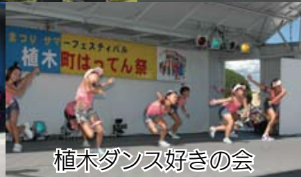
植木ダンス好きの会