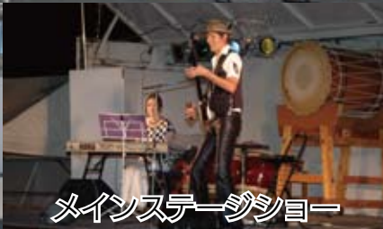
メインステージショー

7月17日植木図書館主催の親と子のお楽しみ会サマースペシャルが開催され、会場は379人の親子でにぎわいました。