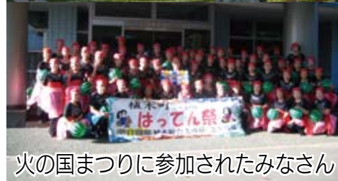
火の国まつりに参加されたみなさん