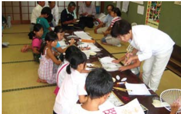
▲植木公民館山本分館における学童保育