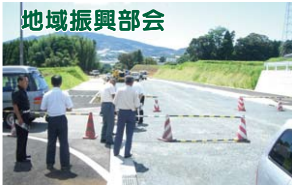
▲地域振興部会による現地視察（投刀塚地区）

8月6日国道3号バイパスの現地調査を行いました。 3号バイパスの1期の事業区間は国道208号から四方寄までの5.6kmであり、平成23年3月には、208号から投刀塚までの2.3kmの区間が一部開通予定です。委員からは、銚田から四方寄区間の開通はいつ頃になるのかなどを総合支所建設課へ質問を行いました。今後3号バイパス期成会にも強く要請を行い1日も早く全線が開通するよう要望しました。