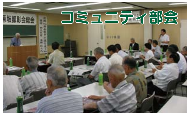
▲田原坂顕彰会総会

7月14日植木総合支所会議室において「植木町西南の役田原坂顕彰会」総会が開催されコミュニティ部会員も出席しました。同顕彰会は193名の会員で運営され、毎年3月20日の戦没者追悼式や田原坂公園等の清掃奉仕活動に取り組んでいます。総会では、本年度の活動計画が決定されたほか、国指定史跡へ向けての準備の状況や、「田原坂資料館」改築計画について報告がありました。また、新規顕彰会会員の募集についても積極的に進めていくということで確認されました。