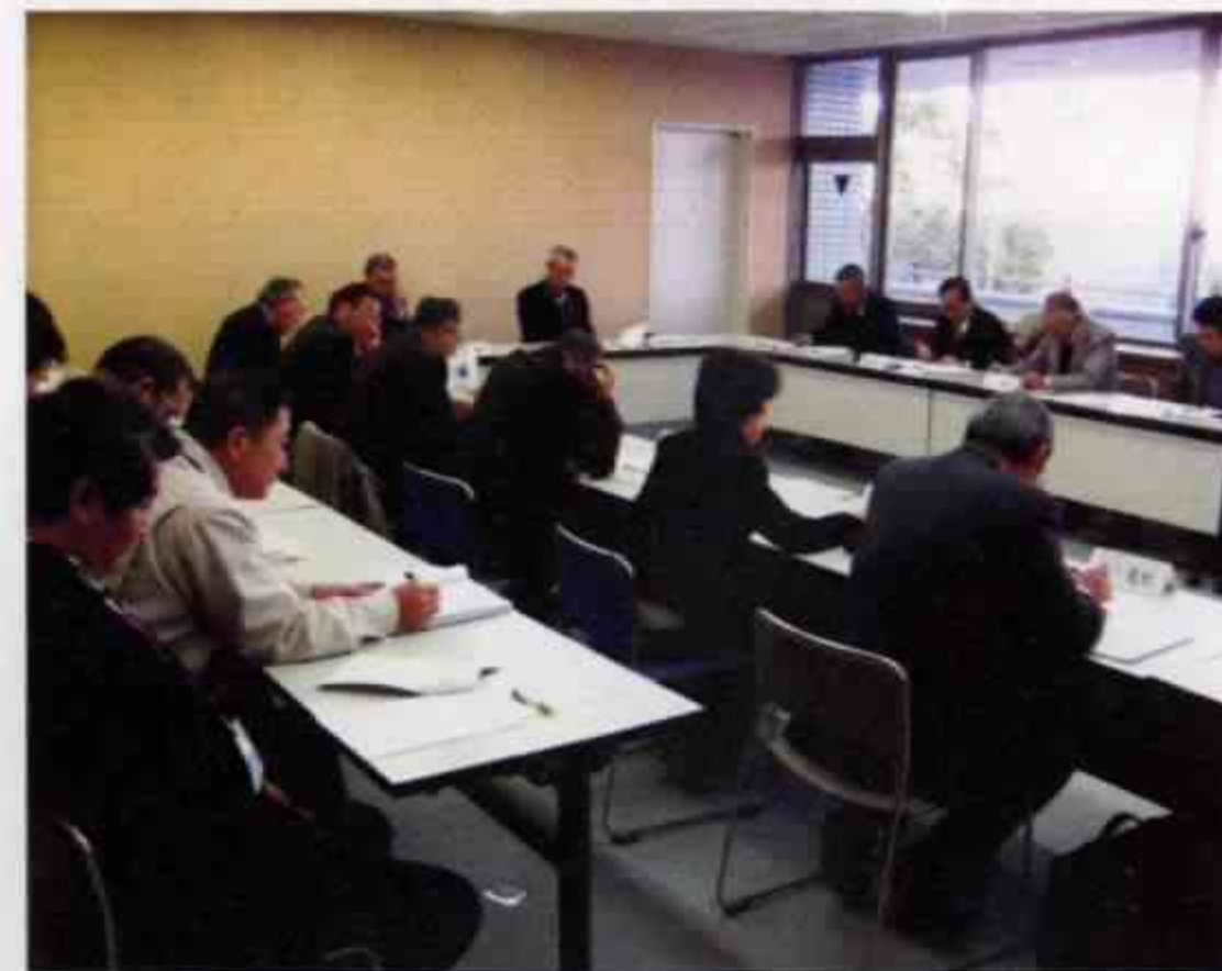
▲第1回合併特例区協議会

平成23年 第1回合併特例区協議会 1月12日協議会が開催され、報告第1号で平成23年度植木町合併特例区一般会計当初予算概算要求（案）の状況について報告がありました。次に3月6日に開催予定の第42回田原坂健康マラソン大会（報告第2号）、3月27日に開催される第14回民謡「田原坂」全国大会（報告第3号）の概要について説明がありました。民謡「田原坂」全国大会では、前回の大会からの改善点について質問があり、年齢別の出場枠の改正により各部門の出場者の平準化が図られたとの回答が事務局からありました。また報告第4号嘱託委員会長会との協議及び依頼事項については、植木地域に限った道路原材料支給制度の導入など7件の報告が事務局からあり、その後、部長から各部会の報告（報告第5号）がありました。